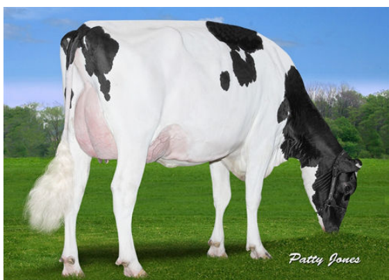
CLAYNOOK FABBY SILVER GRANDDAM